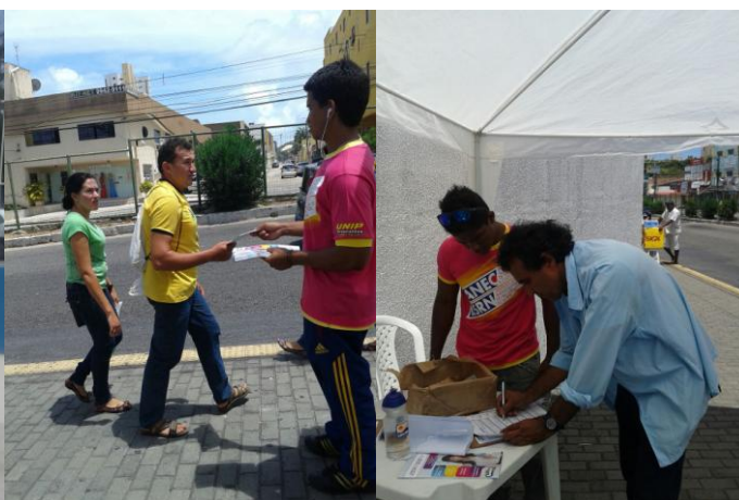
UNP – UNIDADES SALGADO FILHO E NASCIMENTO DE CASTRO