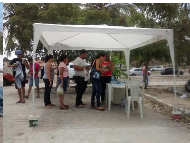
UFRN – SETORES III E VI