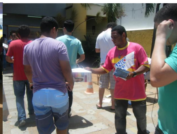
FACULDADE MAURICIO DE NASSAU