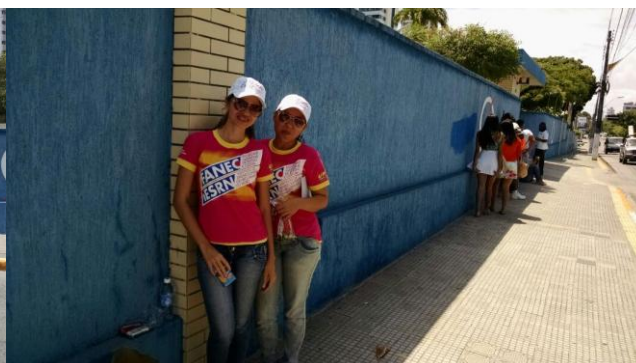
INSTITUTO MARIA AUXILIADORA