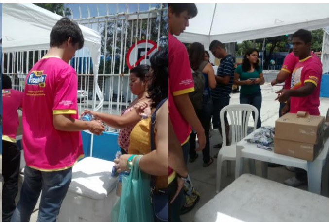
UNP – UNIDADE NASCIMENTO DE CASTRO