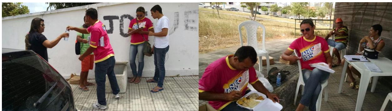
ESCOLA ESTADUAL FLORIANO CAVALCANTI (FLOCA)