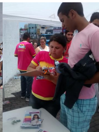
UNP – UNIDADE SALGADO FILHO