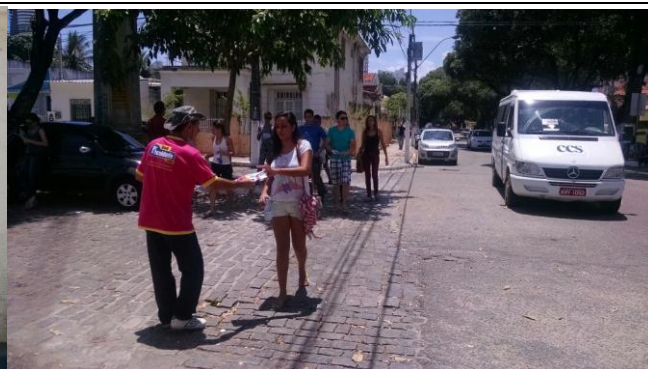
UNP – UNIDADE FLORIANO PEIXOTO