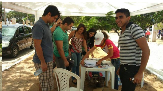
UFRN – SETORES I E II