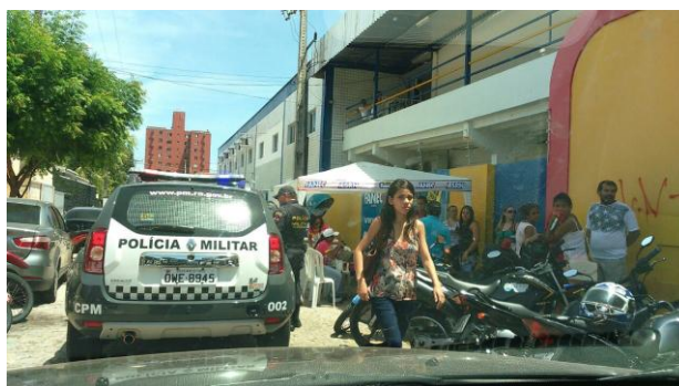
FANEC – UNIDADE CONTEMPORÂNEO (PRISCO)