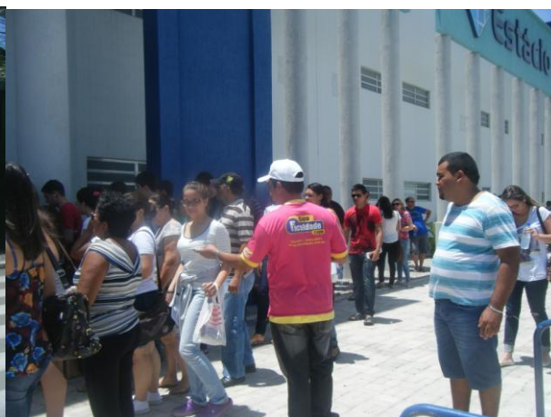
ESTÁCIO – UNIDADE FATERN