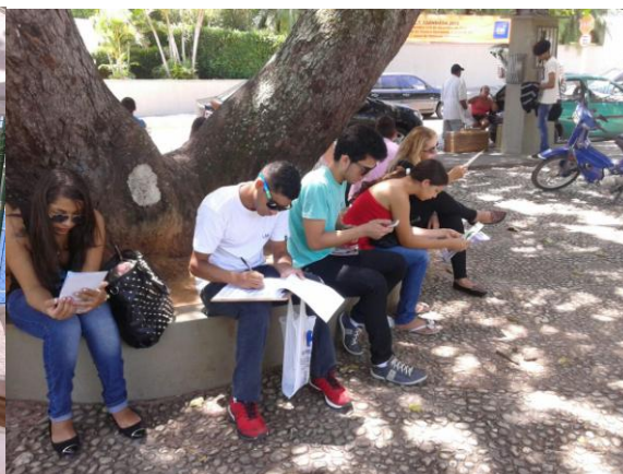
CEI – UNIDADE MIRASSOL