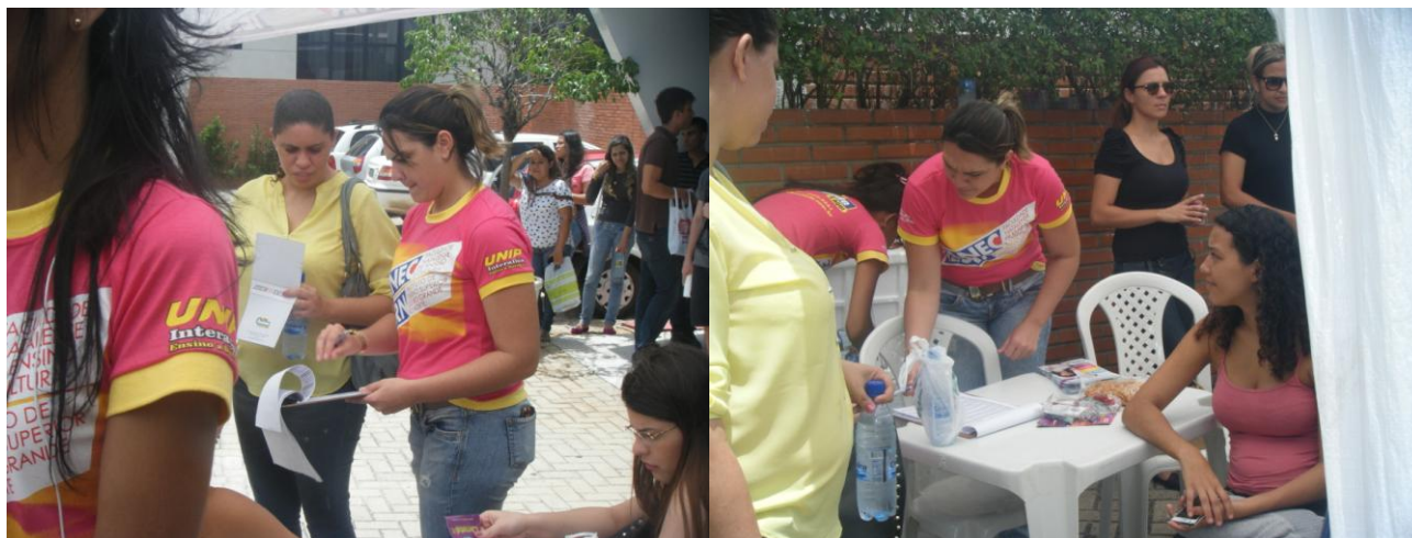
CEI – UNIDADE NASCIMENTO DE CASTRO