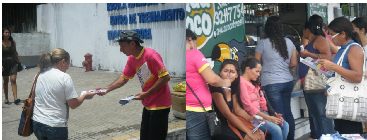
ESCOLA ESTADUAL EDGAR BARBOSA