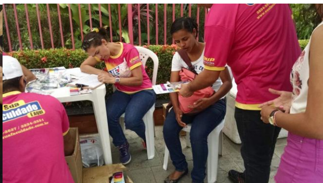
FACEX – UNIDADE II E III