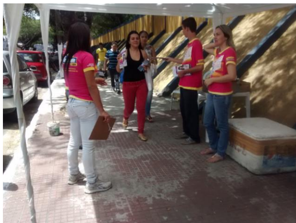
IFRN – CEFET