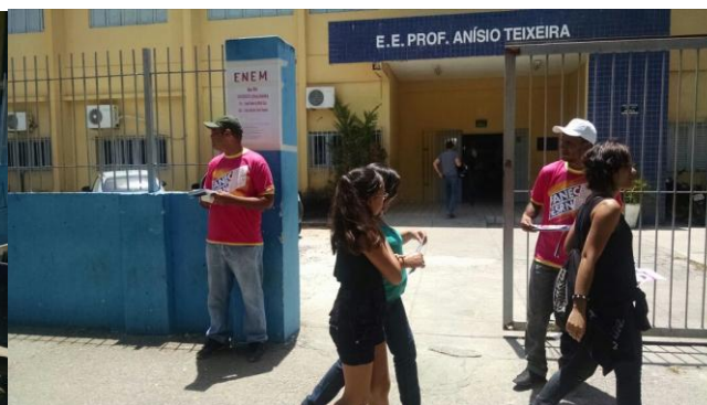
ESCOLA ESTADUAL ANÍSIO TEIXEIRA