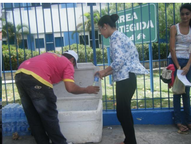
HIPOCRATES – ZONA SUL