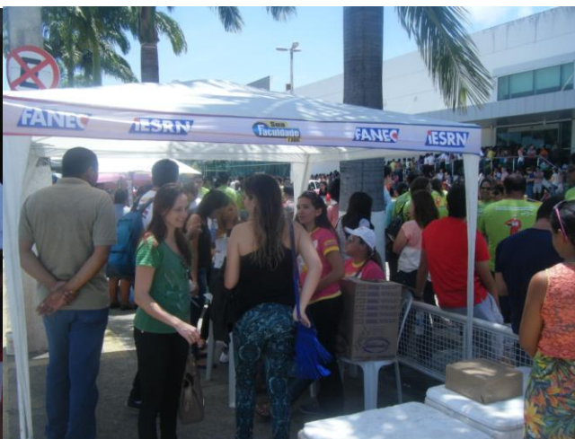
UNP – UNIDADE ROBERTO FREIRE