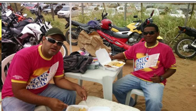
FACULDADE MAURICIO DE NASSAU – PONTA NEGRA