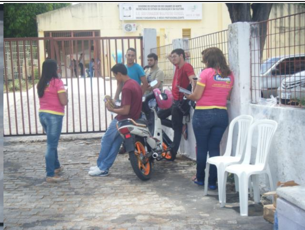
ESCOLA ESTADUAL GOVERNADOR WALFREDO GURGEL